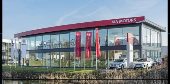
Alphen aan den Rijn